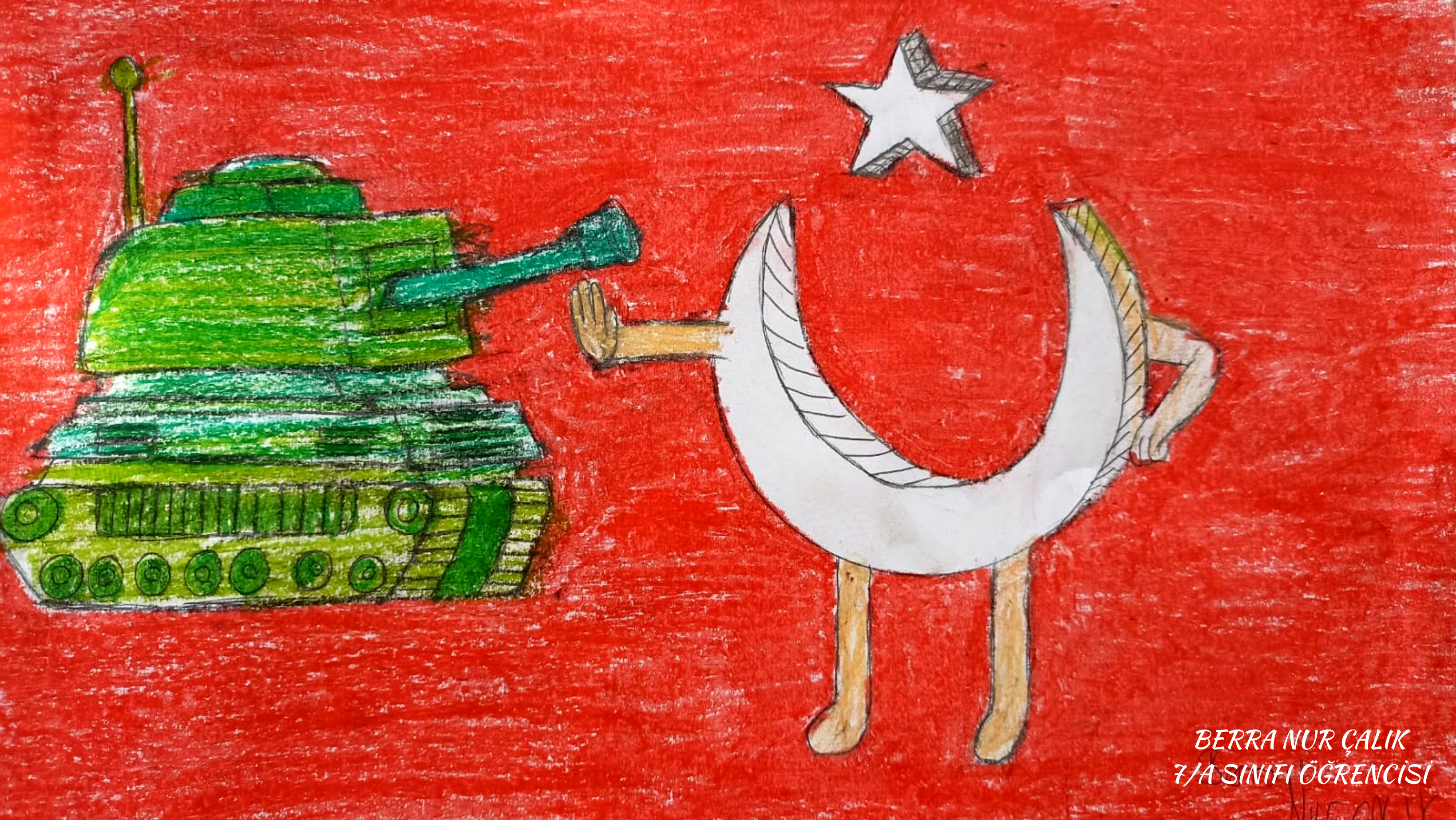
BERRA NUR ÇALIK 7/A SINIFI ÖĞRENCİSİ